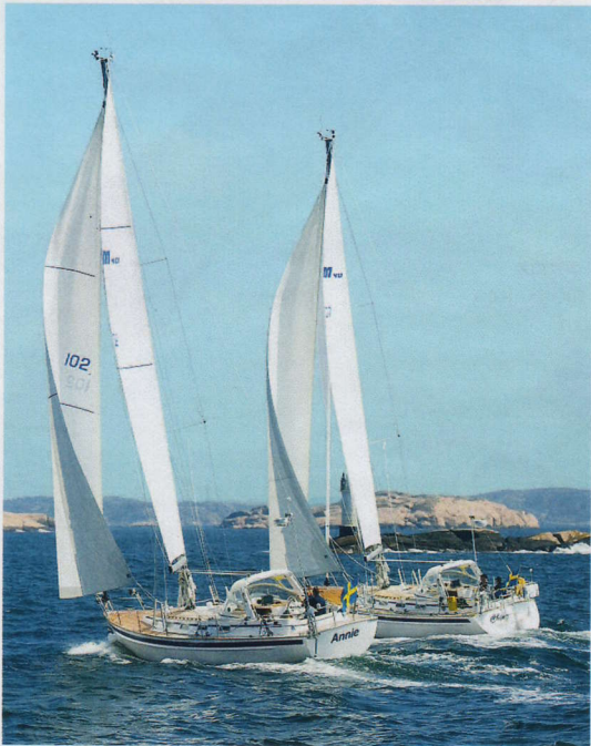
Malö 40 Standard (l.) und Classic bald in neuem Look