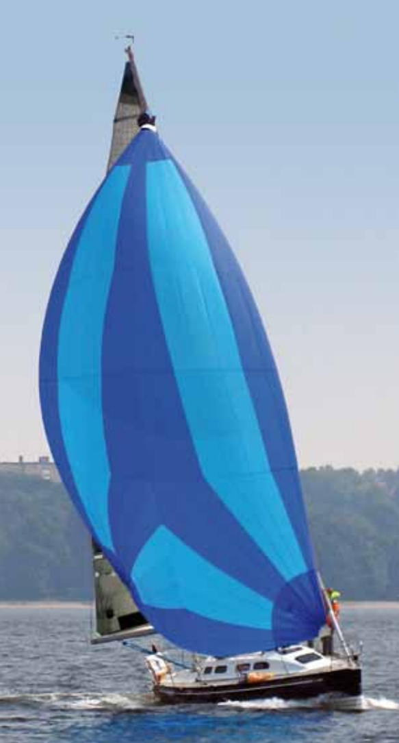
UK Racing Asymmetrischer Spinnaker