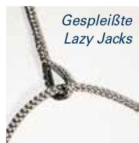
Gespleißte Lazy Jacks

Wir beraten sie gerne, welches System für Sie das geeignete ist.