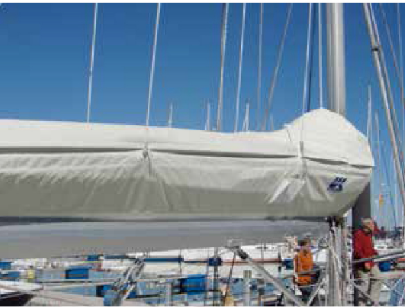
Lazy Jacks und Lazy Cradle